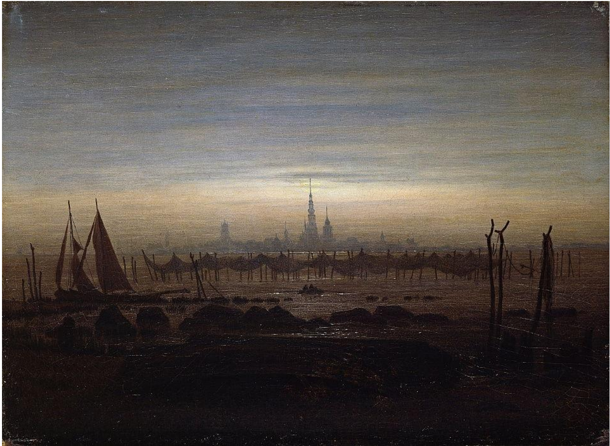
Caspar David Friedrich, 1774-1840, Greifswald im Mondschein (1817), Galerie nationale d'Oslo

Le Nord éveille de plus en plus l'intérêt des Européens méridionaux, et celui de nos compatriotes suisses. A l'heure du réchauffement climatique et de la guerre sur le front oriental, notre curiosité lorgne vers les contrées septentrionales : Islande, Norvège, Suède, Finlande, Danemark et les pays baltes. Le tourisme se tourne vers ces nouvelles destinations, les romans scandinaves atteignent des ventes inégalées en Suisse, les compositions envoûtantes de Hildur Guðnadóttir (musique de Joker et Chernobyl ) reçoivent les plus hautes distinctions. Il y a un véritable emballement pour le Nord de l'Europe.